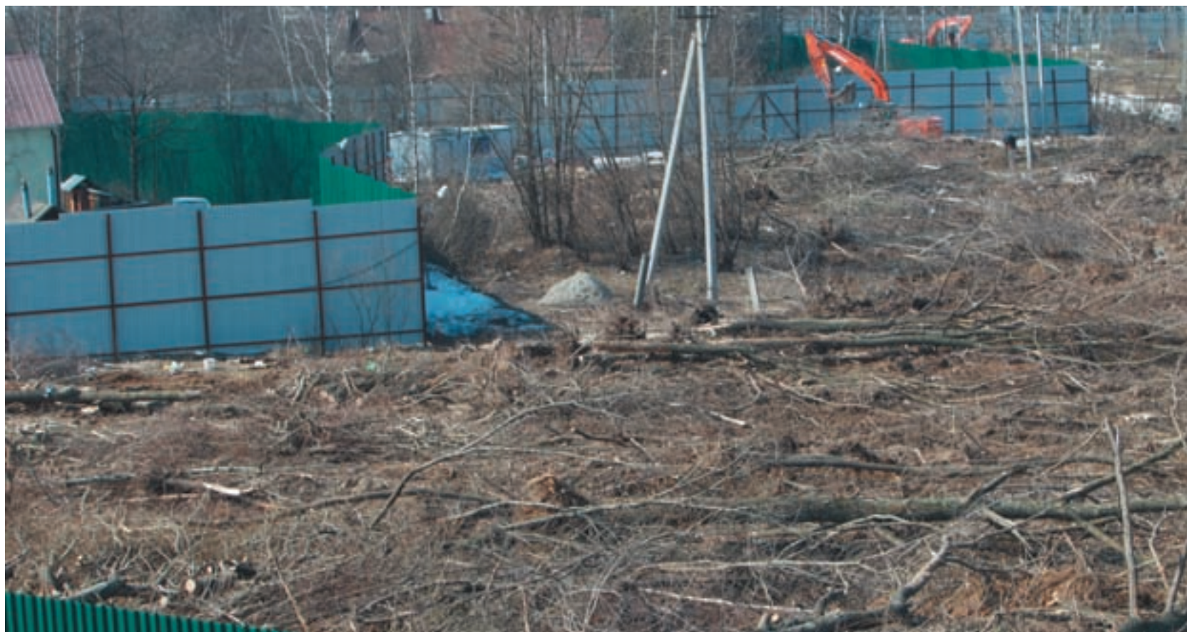
Совсем свежий пример: около 9 га леса вырублено у подмосковного поселка Немчиновка

Глава Рослесхоза Виктор Масляков отправлен в отставку. Но спасет ли это русский лес?