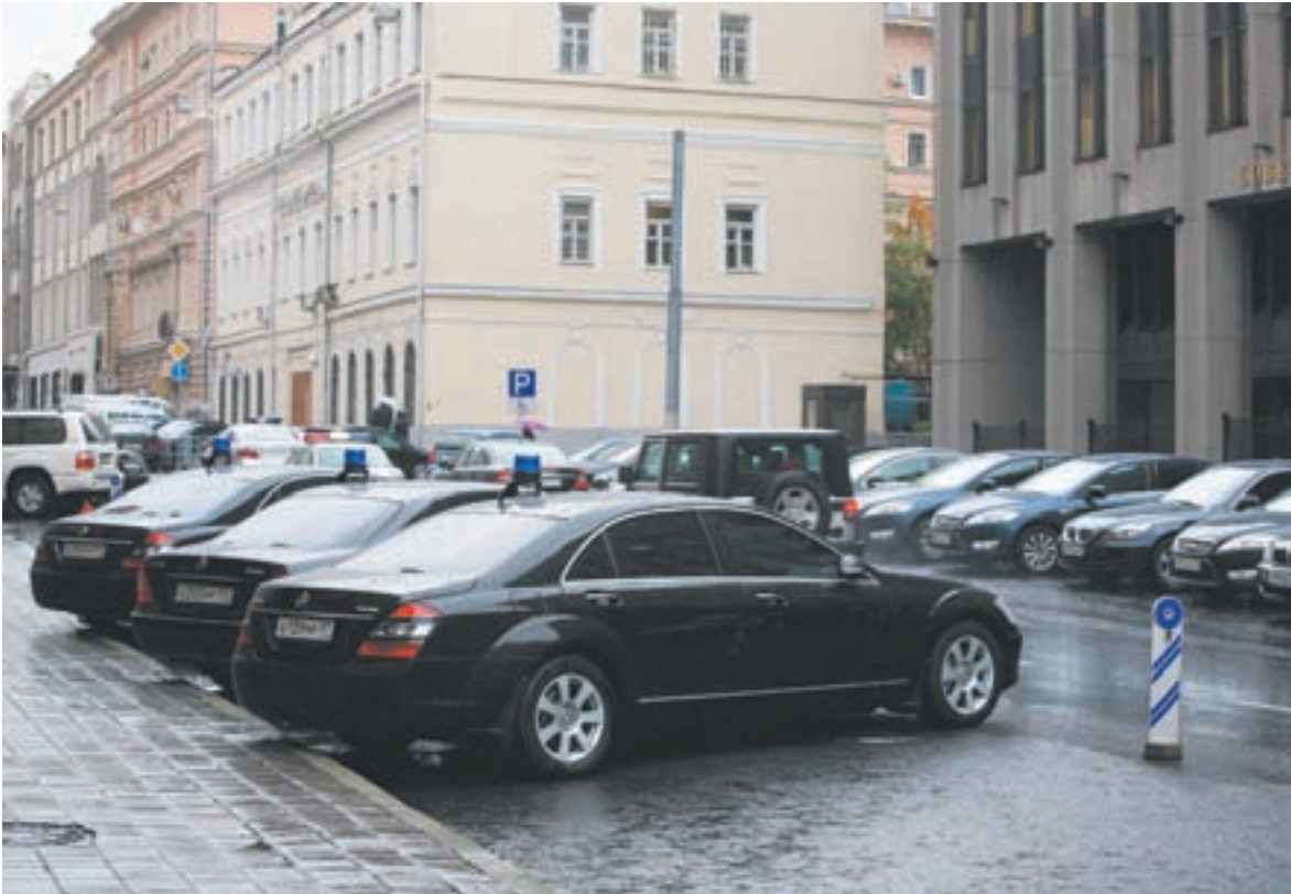
«Мерседес» – рабочий автомобиль сенатора

Декларации представителей правящей элиты заставляют задуматься, зачем им скромная чиновничья доля и в состоянии ли они понять чаяния народа?