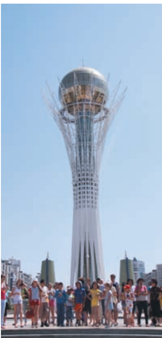
Граждане Казахстана с оптимизмом смотрят в будущее

Учитывая, что новые задачи требуют качественно новых исполнителей, президент Казахстана в своей статье «Социальная модернизация Казахстана: Двадцать шагов к обществу всеобщего труда» наметил основные пути изменения общества. Как он считает, новые производства, новые системы образования и науки, развитие среднего класса, расширение социальных гарантий вызовут большие изменения в сознании граждан. Глава государства уверен, что «процесс модернизации сопровождается усилением активности граждан, раскрытием их творческого