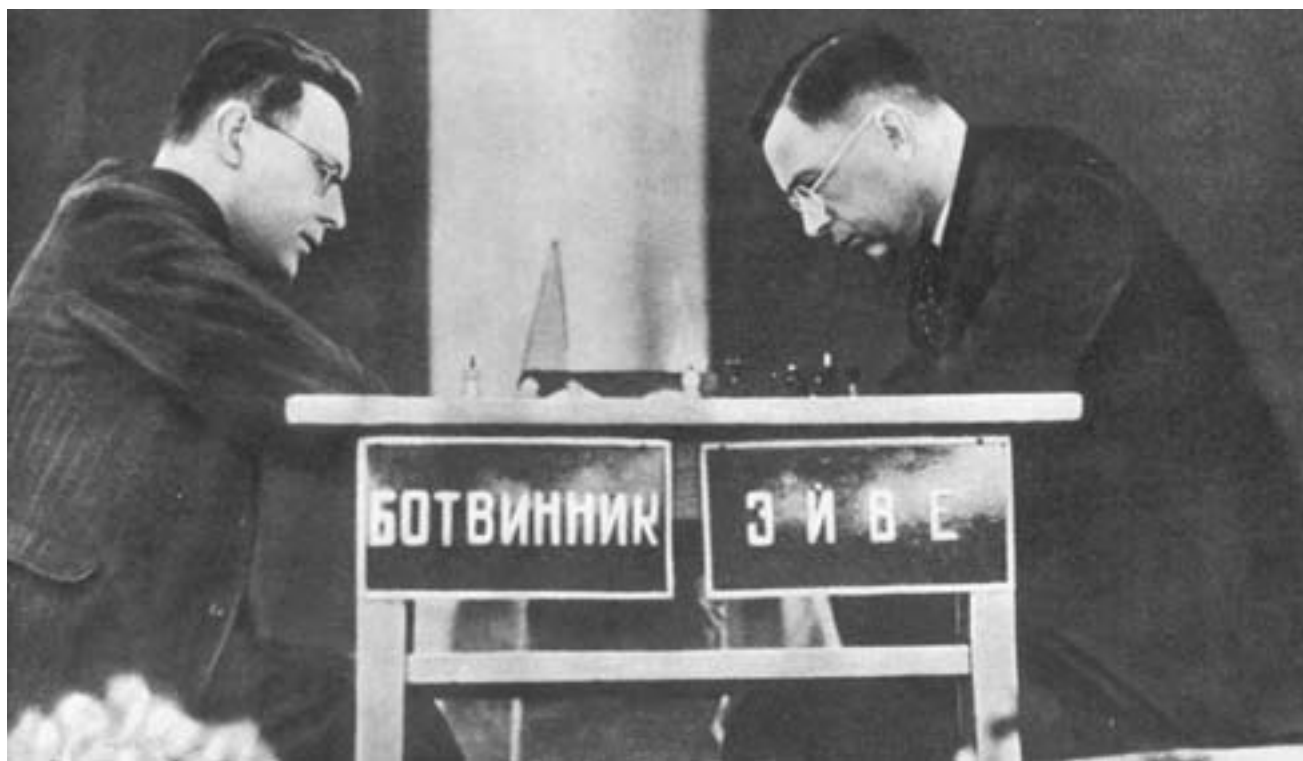
1948 год. Московская часть матча-турнира на звание чемпиона мира

В Гааге и Москве 65 лет назад прошел уникальный шахматный матч-турнир за звание чемпиона мира. Шахматную корону завоевал Михаил Ботвинник.