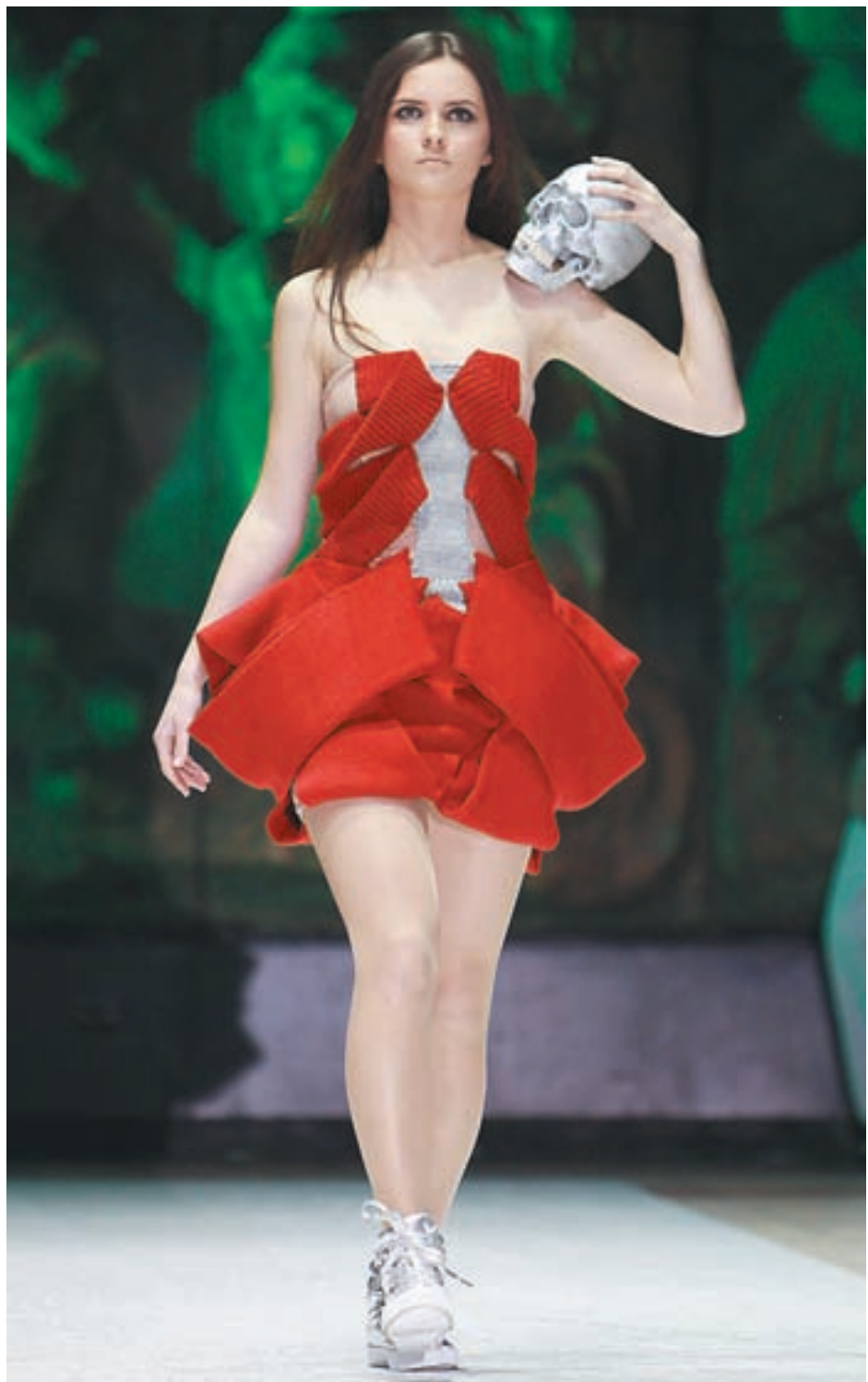
Усопший муж! Я сон твой возмутила? Пренебрегла святынею могильной? На модный подиум с тобой я выходила. Несла твой череп – серебристый, пыльный...