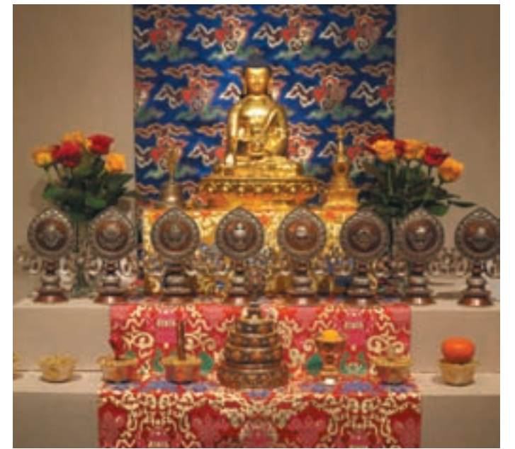
Один из экспонатов выставки «Сокровища Гималаев»