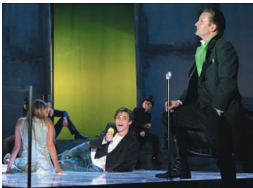
Сцена из спектакля «Портрет Дориана Грея»