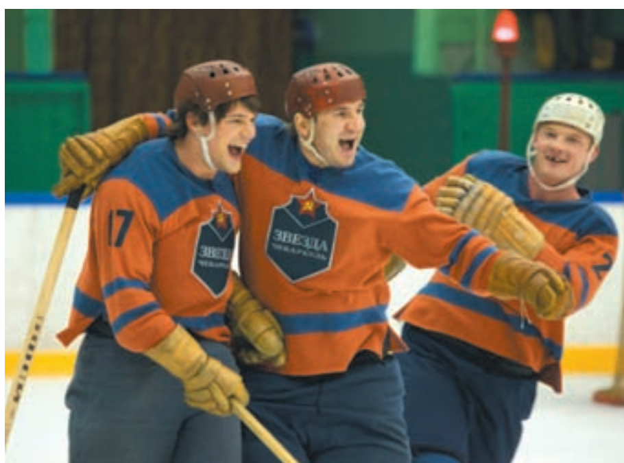
Кадр из фильма «Легенда № 17»

18 апреля в отечественный прокат выходит новый фильм Николая Лебедева «Легенда № 17». Изначально картина позиционировалась как миф о Валерии Харламове. Однако на самом деле кино получилось не только о великом хоккеисте.