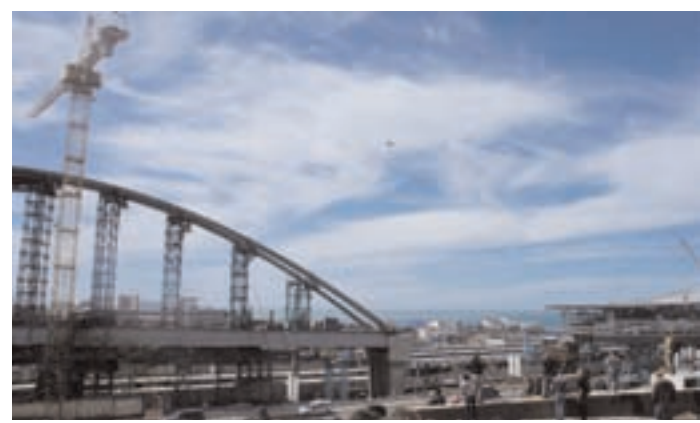
Строительство дорог в Сочи идет с опережением графика