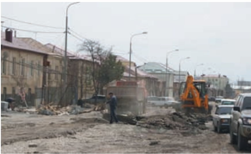
Цхинвал-2013. За год ничего не изменилось

По данным газеты «Ведомости», за два года из федерального бюджета России в Южную Осетию ушло 21,7 млрд рублей. Согласно докладу международного неправительственного экспертного центра International Crisis Group (ICG), с момента конфликта в августе 2008 года Россия выделила РЮО в общей сложности 840 млн долларов. На каждого жителя пришлось порядка 28 тыс. долларов. По другим данным, с 2007 года республика получила около 40 млрд рублей, или 1